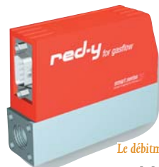
Le débitmètre simple

On soupçonne aussi des coûts de production réduits qui devraient se répercuter sur le prix de vente. « Pour un modèle standard à 50 ml/min, un modèle Cmos en boîtier Inox se situe vers 600 euros, contre 750 euros pour un débitmètre thermique classique », indique Philippe Escaich, responsable des ventes chez Vögtlin en France. Il faut compter 500 euros pour un boîtier en aluminium ». Puis viennent des avantages plus discrets, cachés dans les méandres des microgra-