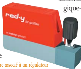
Le débitmètre associé à un régulateur

vures de la puce. L'amplification du signal à proximité de l'élément